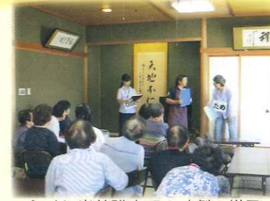
ふくし出前講座での寸劇の様子

◇支え合いマップづくりやニーズ調査から見えた買い物や移動のニーズについて地域の実情に応じた仕組みづくりを検討します。