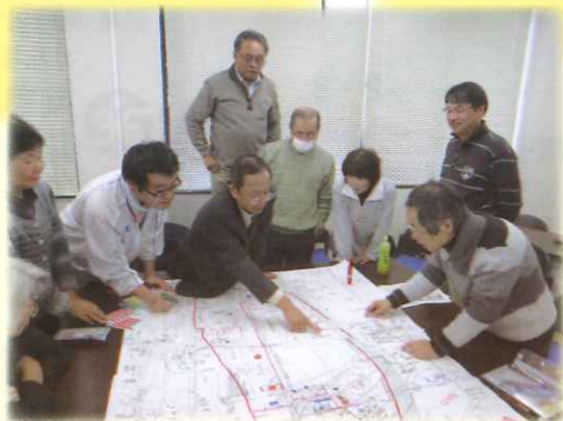
支え合いマップづくり